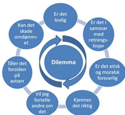
Figur 7: Dilemmasirkelen, kilde: Kvalnes, Øverenget 2012

Etisk bevissthet blant ansatte og ledere er viktige forebyggende elementer. Enkeltpersoners integritet og motstandskraft i møte med dilemmaer, interessekonflikter og mulige fristelser kan være avgjørende for hvordan den enkelte handler i krevende situasjoner. Dilemmatrening er et godt og hensiktsmessig verktøy for å øve opp den enkeltes evne til å vurdere etisk forsvarlighet. Dilemmasirkelen kan benyttes når de ulike problemstillingene diskuteres.